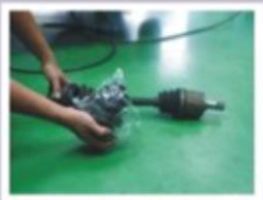
傳動軸防塵套更換