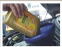
自動變速器油更換