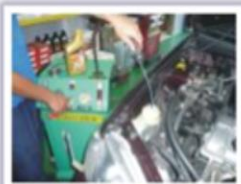
動力方向盤油更換